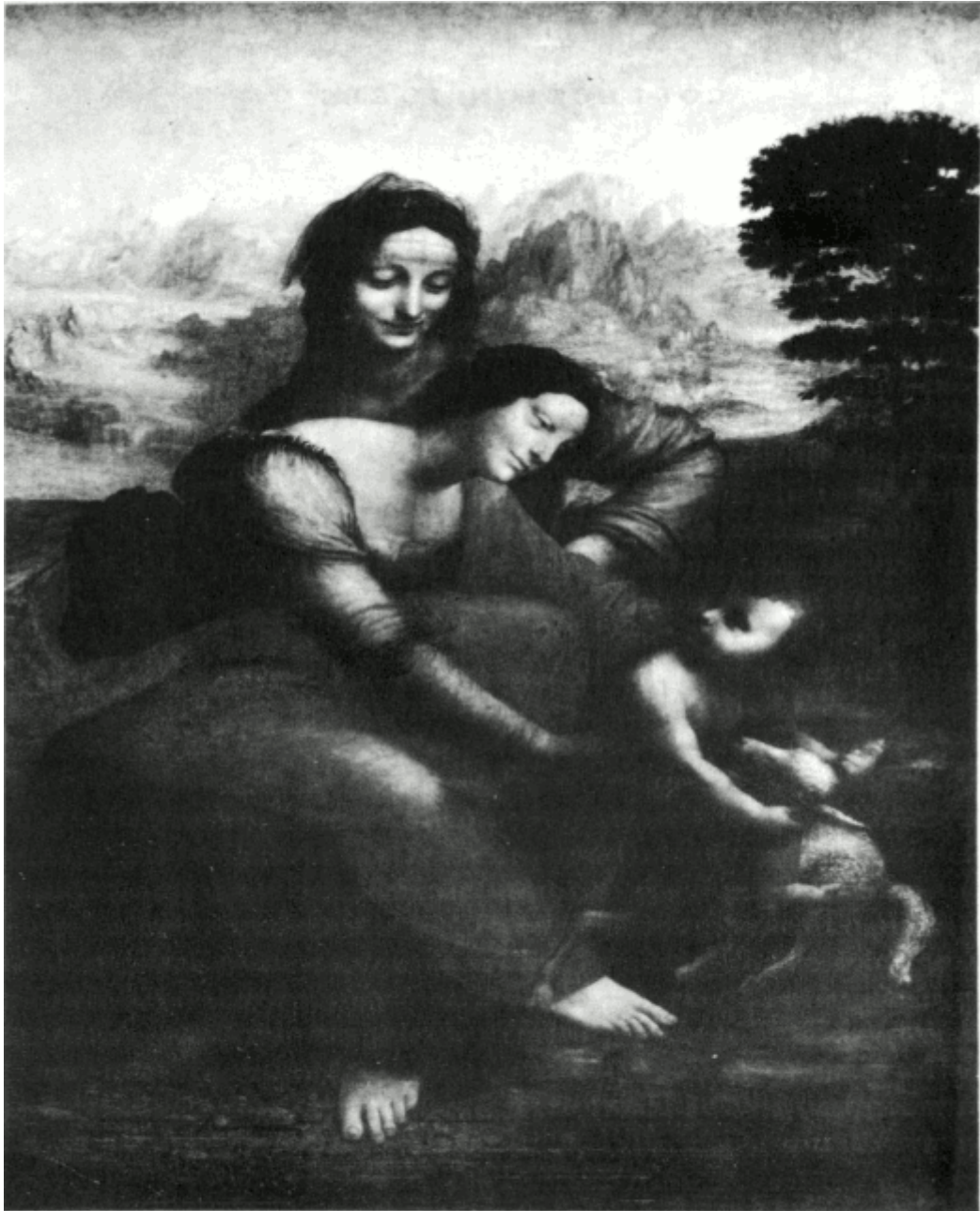
La Vierge, l'Enfant Jésus, sainte Anne. Musée du Louvre.

Un souvenir d'enfance de Léonard de Vinci